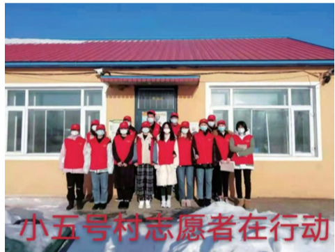
计BG202宗柏吉在吉林省扶余市新源镇小五号村志愿服务