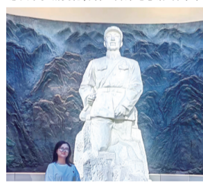
在“永恒的丰碑”前与雷锋叔叔的合影。习近平总书记指出,雷锋是时代的楷模,雷锋精神是永恒的。我们要学习雷锋精神,把崇高理想信念和道德品质追求转化为具体行动,体现在平凡的生活里,把雷锋精神代代传下去。

自己身边的小变化——在政府的帮助下进行的农村房屋改造让全村的房屋焕然一新;村里的垃圾有了秩序化、规范化的管理点和投放点;全民健身设施普及到乡村广场等,镜头里的家乡大变样,村子里的乡亲们生活环境也有了切实的改善。