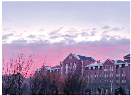
▲ (智能 BG211 刘冰棋)