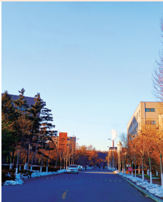
▲ (广告 BG212 王丹)

人生的价值也不只六便士，还有名为热爱的月亮。总有人承受着黄昏与风雨，去采摘夕阳易碎的美好。